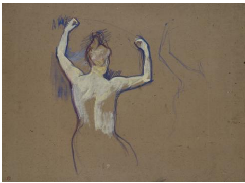
HTL, Ballet de Papa Chrysanthème, 1892 Musée Toulouse-Lautrec, Albi, Tarn, France

Au cours des dix dernières années, la Fondation Teloglion a organisé de nombreuses expositions consacrées à de grands artistes tels que Miro ou Picasso ou visant à faire connaître des mouvements artistiques ou des périodes ayant marqué l'art (classicisme, art romain, tragédie grecque...).