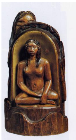
Paul Gauguin, Idole à la perle

Le mTL participe à cette exposition en prêtant l'œuvre Le Golfe de St Tropez (dépôt d'Etat).