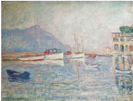
Blanche Hoschedé-Monet, Port de Saint-Jean-Cap-Ferrat