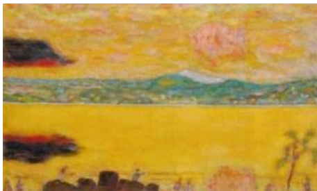
P. Bonnard, Le Golfe de St Tropez

Le mTL s'associe à cette exposition en prêtant une huile sur toile, Port de Saint-Jean-Cap-Ferrat .