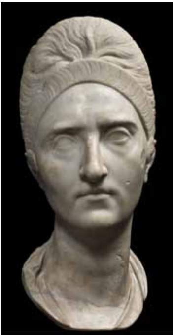
Portrait de Plotine, épouse de Trajan. Musées du Capitole à Rome Photographie © Archivio Fotografico dei Musei Capitolini.

À une époque où l'écrit ne s'adresse qu'à une élite, le portrait officiel sert d'instrument de propagande et s'avère l'un des éléments les plus importants de la politique impériale.