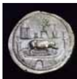
Musée de Millau Aveyron