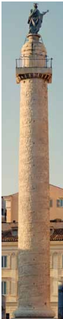
Colonne de Trajan. Rome

La diffusion de l'image impériale sur tout le territoire romain utilise de multiples supports, du plus prestigieux au plus commun.