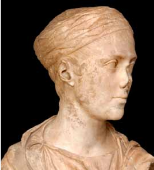
Buste d'une inconnue.