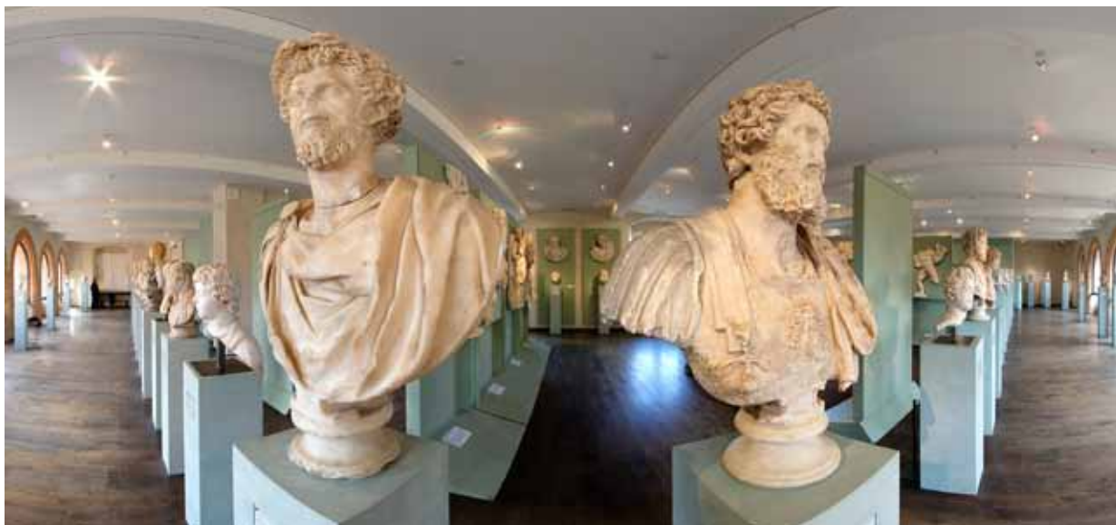
1 er étage du musée Saint-Raymond, «Villa de Chiragan ».

Toutes les œuvres exposées au premier étage du musée proviennent de la villa romaine de Chiragan . Le domaine de Chiragan est un site antique connu depuis le XVI e siècle, à une soixantaine de kilomètres au sud-ouest de Toulouse, en bordure de Garonne, sur la route qui reliait Tolosa , la Toulouse antique, à Lugdunum des Convènes, aujourd'hui Saint-Bertrand-de-Comminges. Situé sur la commune actuelle de Martres-Tolosane, dans l'Antiquité il appartenait au territoire de la cité de Tolosa .