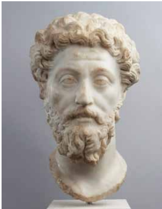
Portrait de Marc Aurèle.

Ainsi, Antonin le Pieux accéda au pouvoir par son adoption par Hadrien et à la condition qu'il adopte en retour Marc Aurèle.