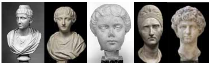
Hanovre (Allemagne), Kestner-Museum