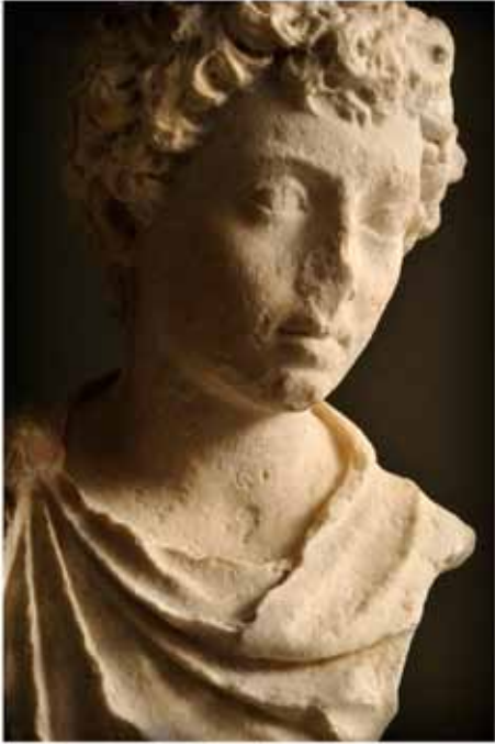
Buste de Marc Aurèle jeune. Rodez, musée Fenaille.

POURQUOI L'EMPEREUR MULTIPLIE-T-IL LES REPRÉSENTATIONS À SON IMAGE ?