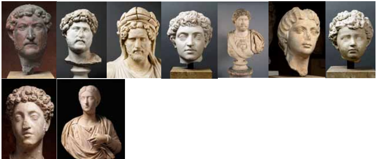
Paris, Cabinet des médailles