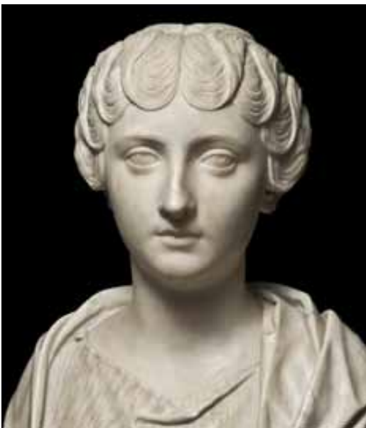
Buste de Faustine la Jeune.

L'exposition rappelle ainsi combien le rôle des femmes était discret mais leur position déterminante. De nombreux portraits féminins y trouvent leur place : impératrices, filles et nièces d'empereurs, mais aussi des représentations d'inconnues.