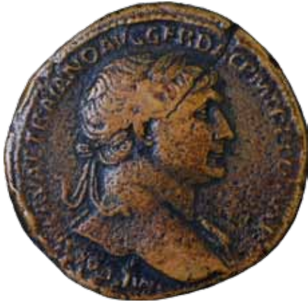
Sesterce de Trajan. Bronze. 108-114. MNR.