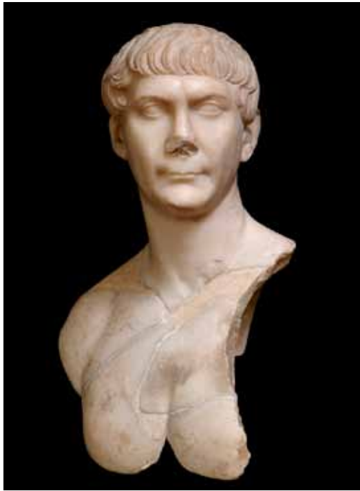
Buste de Trajan.